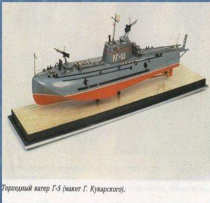
Торпедный катер Г-5 (макет Г. Кукарского).