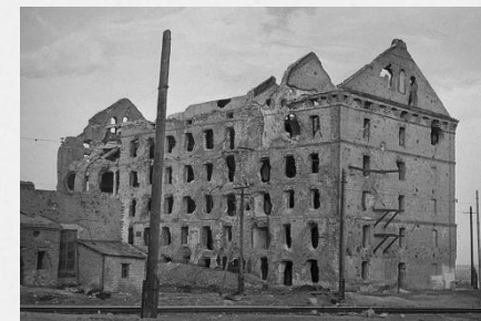
Легендарный Дом Павлова