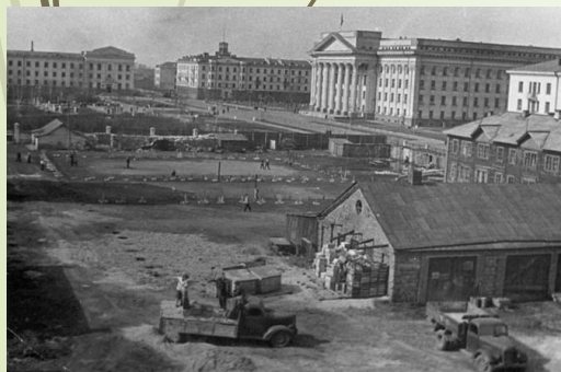
Базарная площадь в Тюмени сейчас нет, на ее месте построили правительственный квартал