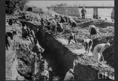
На постройке противотанкового рва